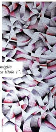
Da sinistra: "Groviglio danzante", "Senza titolo 1".